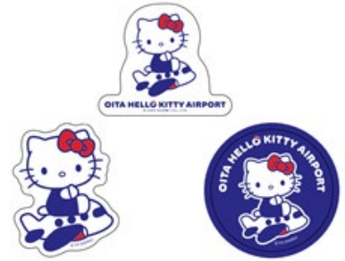
ステッカー（全3種） 各396円