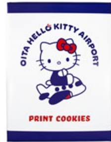
プリントクッキー 756円