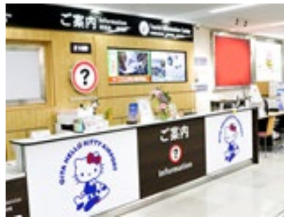
国内線1階インフォメーション