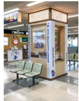
到着ロビー柱装飾