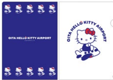
クリアファイル 440円