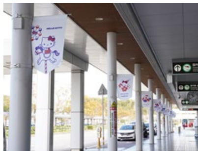
国内線ビル玄関フラッグ