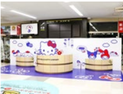
到着ロビーフォトスポット