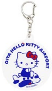
アクリルキーホルダー 660円

販売場所：大分空港 国内線ターミナル2階 空の駅「旅人」（たびと）、ハーモニーランド内ショップ「カントリーマーケット」